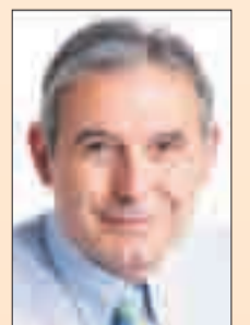
M. Enric Llorca i Ibáñez Alcalde de Sant Andreu de la Barca

També continuem treballant en la reactivació del mercat laboral en la mesura de les nostres possibilitats, amb les eines i recursos dels que disposem. Malgrat el foment de l'ocupació i la creació de llocs de feina no són competència de les administracions locals, l'Ajuntament continua treballant no només per fomentar l'ocupació, amb programes com les subvencions mensuals a les empreses que contractin desocupats, sinó també en l'atracció d'empreses i que aquestes s'instal·lin a la nostra ciutat per contribuir a generar llocs d'ocupació i riquesa.