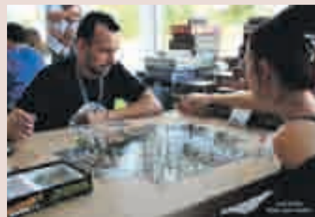
Moment de la segona jornada de jocs de taula de la Festa Major

Durant la celebració de la Festa Major, el dissabte 5 de setembre, la plaça 11 de se-