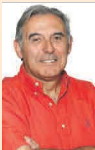
M. Enric Llorca i Ibáñez Alcalde de Sant Andreu de la Barca

Al marge de les comeses electorals, l'Ajuntament ha reprès la seva activitat després de l'estiu amb l'aplicació de noves propostes i la posada en marxa d'idees que tenen com a finalitat millorar la qualitat de vida de les persones. Les eleccions a les que estem convocats el diumenge 27 de setembre també són importants per l'Ajuntament i per la gestió municipal perquè haurem de veure amb quins suports comptem les administracions locals, si podem confiar amb l'ajut en forma de subvencions d'altres administracions o, si pel contrari, hem de continuar fent front en solitari als problemes derivats de la pitjor crisi econòmica, si hem de limitar-nos als nostres recursos per donar resposta a les necessitats bàsiques dels nostres ciutadans i ciutadanes. És per tot això que us insto a votar el pròxim dia 27 de setembre i a pronunciar-vos sobre com voleu que sigui la societat del futur.