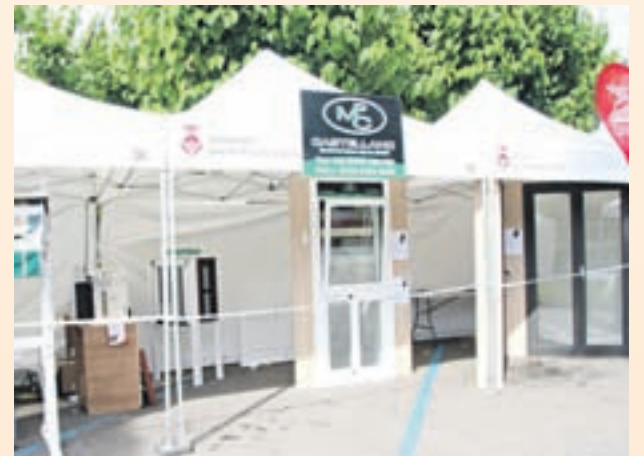
Tercer premio: MONTAJES PEDRO CASTELLANO