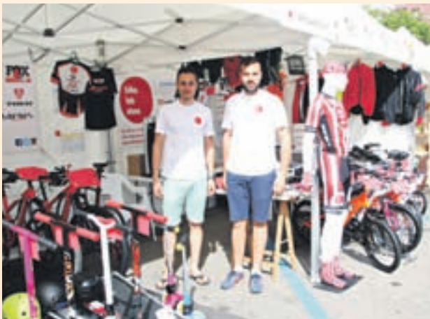
Primer premio: BIKE LAB STORE