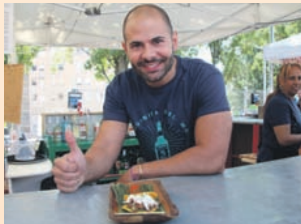
Segundo premio: LA ESQUINITA DEL MOJITO (Cachapita)