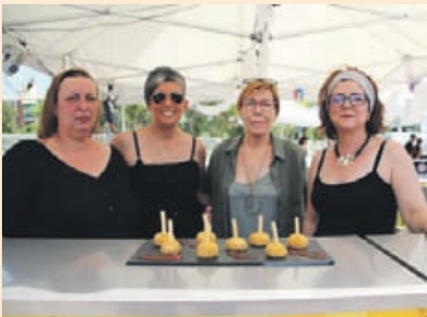
Primer premio: EL TEU CAFÈ (Bolita crujiente)