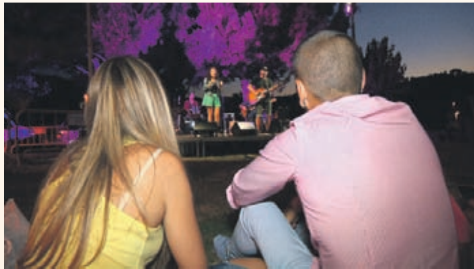
Llobregat, on també s'han programat activitats culturals i lúdiques.

Aquest estiu també s'estrenarà un espai nou: la zona de pic-nic que hi haurà entre l'Autovia del Baix Llobregat (A2) i el riu