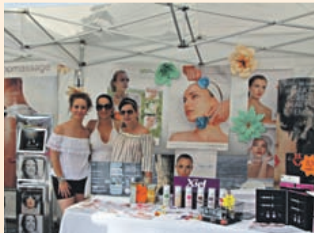
Seundo premio: NOVADERMIS