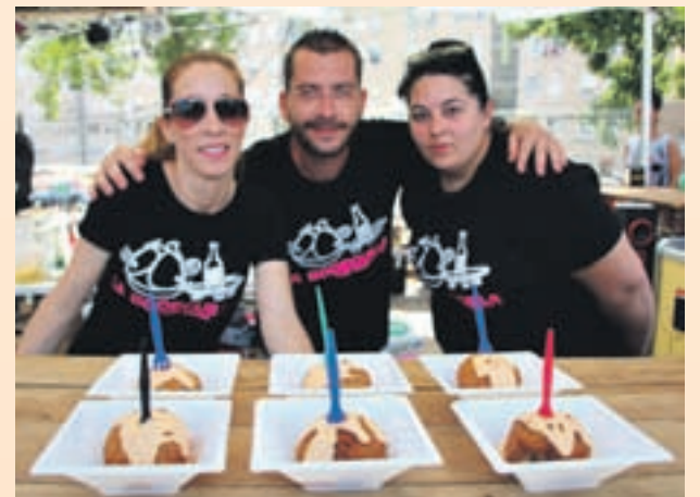
Tercer premio: LA BODEGUILLA (La bomba)