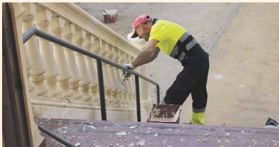
Aprofitant l'estiu s'han fet obres de millora i condicionament als centres escolars.