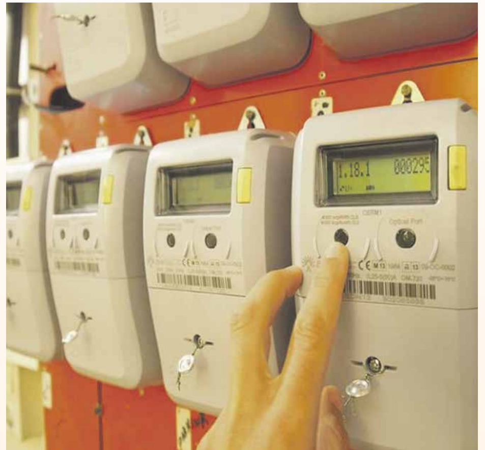
El Ayuntamiento evita el corte de suministro a las familias vulnerables

"Ni en los peores momentos de la crisis se ha cortado la luz, el agua o el gas a ningún vecino y seguiremos trabajando para que esto sea así"