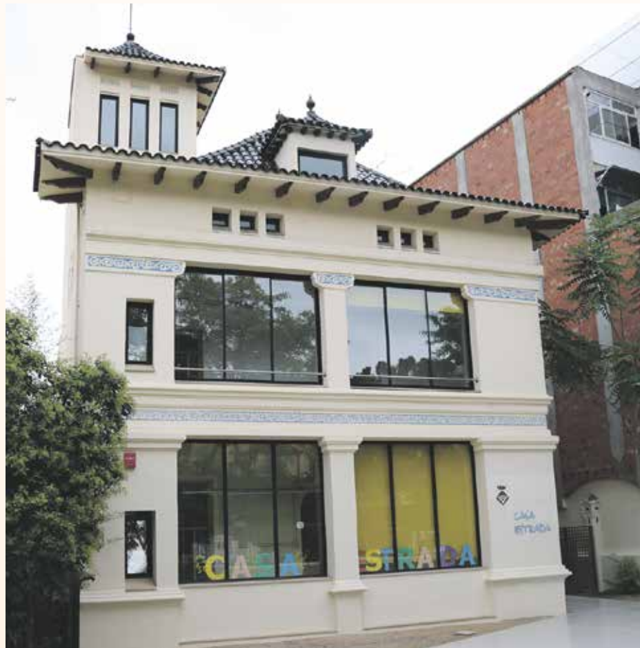
La Casa Estrada tornarà a acollir alumnes d'escola bressol