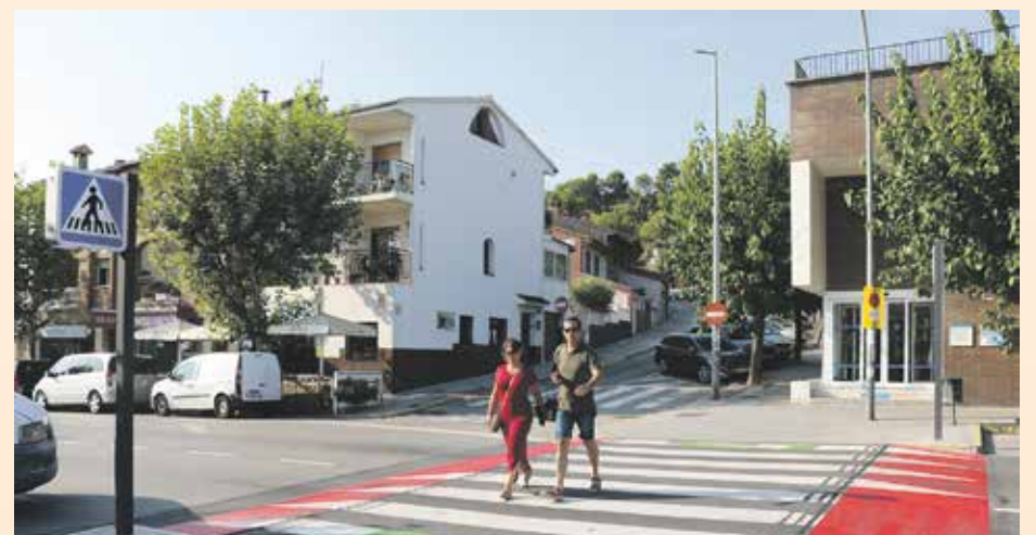
Uno de los pasos de peatones inteligentes se ha instalado delante del CAP