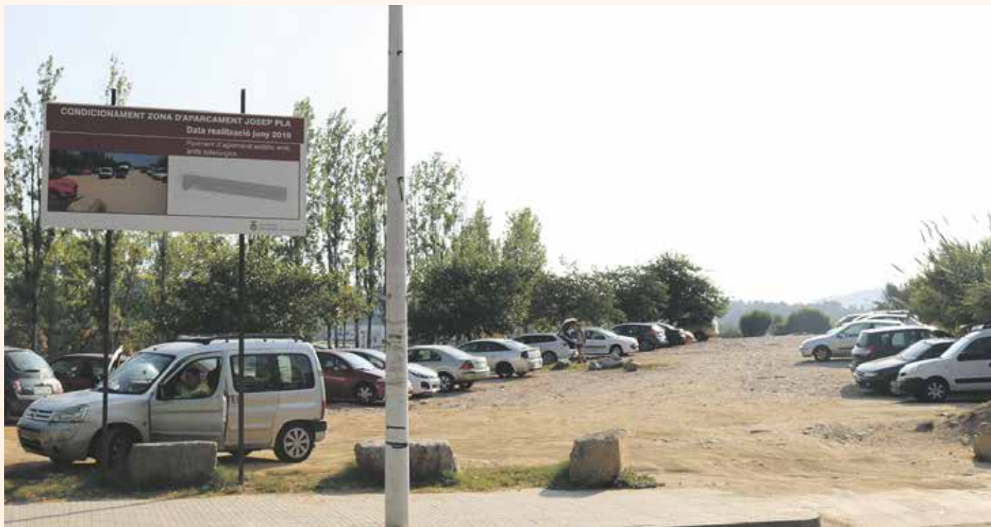
El nuevo aparcamiento se construirá con un material innovador que fomenta el reciclaje

Más aparcamiento en La Solana El plan para mejorar el aparcamiento en el barrio de La Solana prevé también la habilitación de 93 aparcamientos frente a la empresa Integra 2 y está prevista la construcción de otro aparcamiento en el otro extremo del barrio, en la zona de la avenida Argentina. El proyecto se completa con la creación de una zona de aparcamiento con más de un centenar de plazas en el Pla de l'Estació.