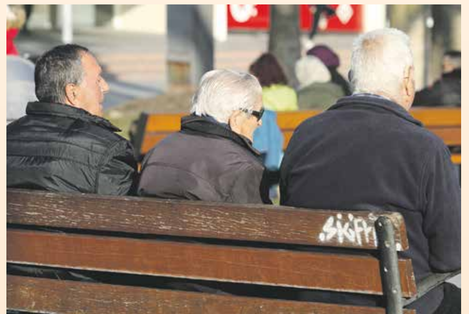
Las ayudas se pueden pedir en el ayuntamiento hasta el 30 de septiembre

Las personas beneficiarias tienen que tener unos ingresos iguales o inferiores al Salario Mínimo Interprofesional (SMI) y cumplir una serie de requisitos, como por ejemplo tener contratadas las tarifas o bonos sociales previstos para personas mayores, estar empadronadas en la ciudad desde hace más de dos años o que la ayuda sea para la vivienda habitual.