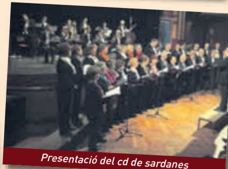
Presentació del cd de sardanes