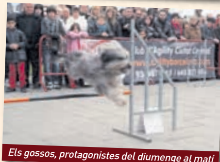
Els gossos, protagonistes del diumenge al matí