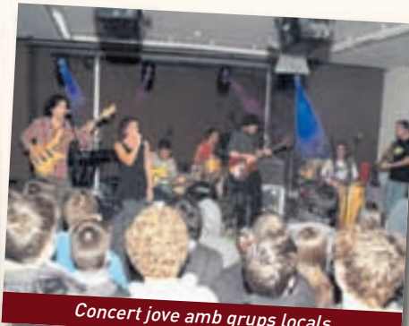
Concert jove amb grups locals