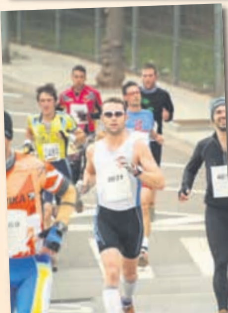
Duatló per la ciutat