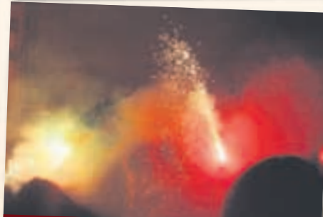
Correfoc amb els Diablers de Sant Andreu