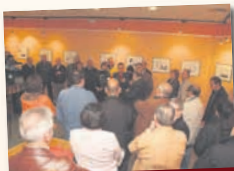
Exposició 900 anys de Sant Andreu de la Barca

Així ha estat la Festa de Sant Andreu, celebrada del 27 al 30 de novembre.