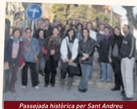
Passejada històrica per Sant Andreu