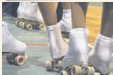
Nova edició del Festival de Patinatge Artístic