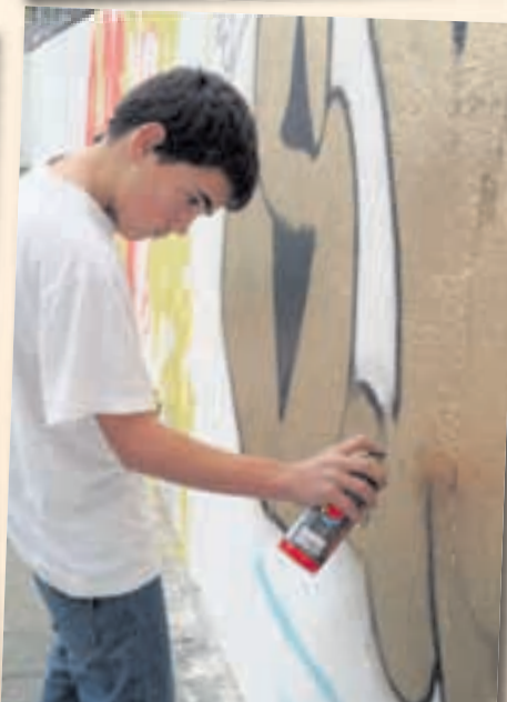
Els joves van poder fer els seus grafits