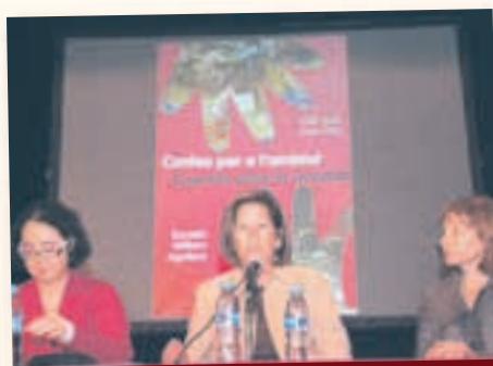
Presentació del llibre de contes solidaris