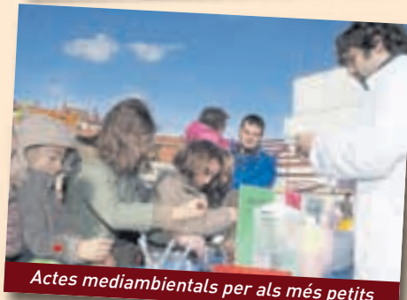
Actes mediambientals per als més petits