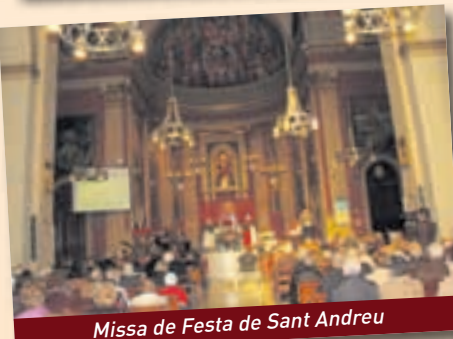
Missa de Festa de Sant Andreu