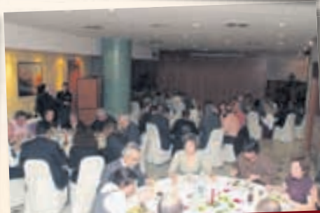
Sopar de Festa de Sant Andreu