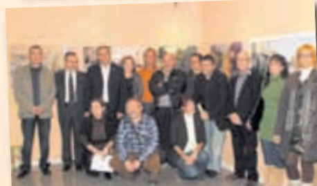
Guanyadors del concurs de Pintura Ràpida