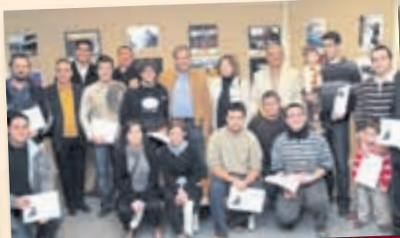
Els guanyadors i finalistes del concurs de fotografia