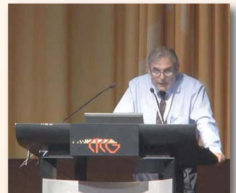
Sant Andreu TV

Andreu de la Barca y de su alcalde como de "líder en el trabajo para que la salud sea fundamental en el desarrollo de la ciudades".