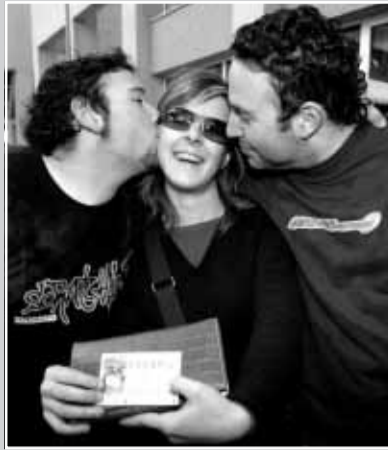
Alegría en Muro (Mallorca)