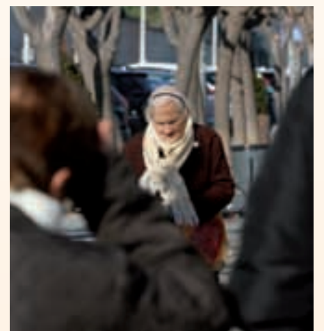
L'atenció als ciutadans és l'objectiu principal dels pressupostos

"Hi ha actuacions que corresponen a d'altres administracions que no es fan però que són fonamentals per a la nostra ciutat, com ara el cobriment de les vies" ha dit Llorca, que ha assegurat que "si aquestes administracions desatenen les nostres necessitats ho farem des de l'Ajuntament".