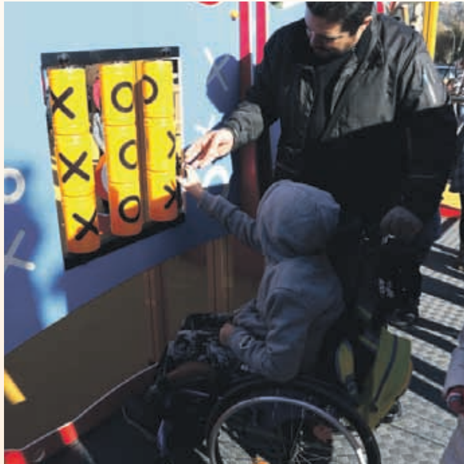
L'objectiu és adaptar la ciutat a persones amb necessitats especials

El consistori també ha reclamat la igualtat de drets de les persones amb