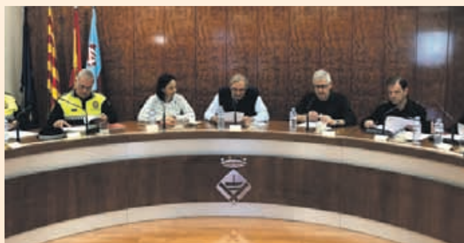
Imagen de la Junta Local de Seguridad

Respecto al resto de infracciones penales, los delitos contra el patrimonio