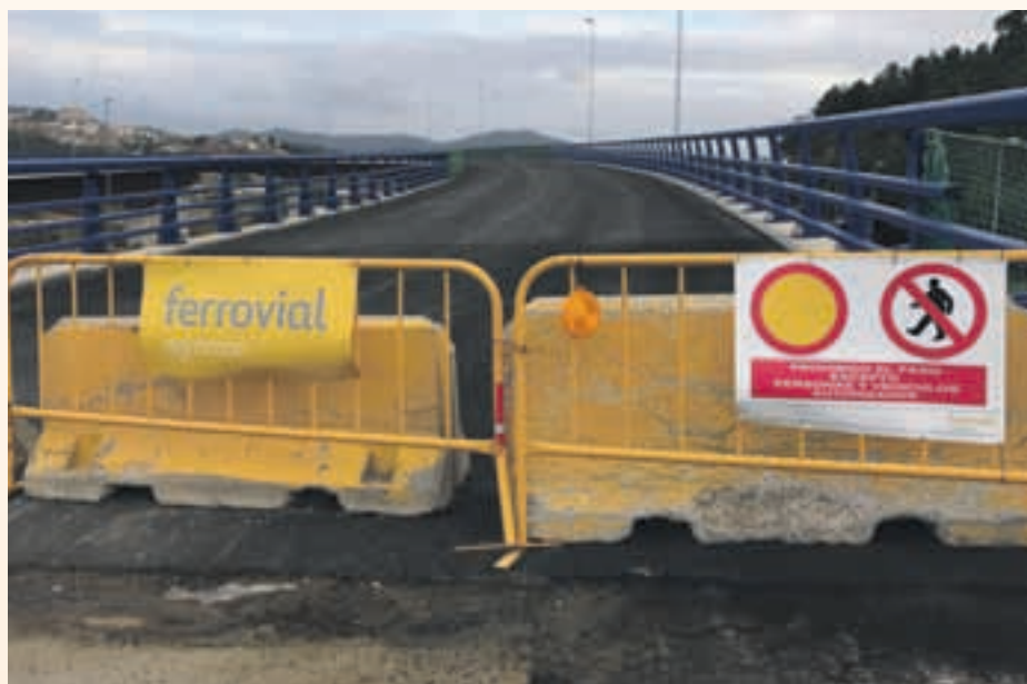
Las obras se pararon hace meses y cuando se retomen tienen un periodo de ejecución de 18 meses

La conexión de la AP7 y la A2 estaba pendiente de la modificación del proyecto inicial, que tenía que aprobar el Consejo de Estado, un trámite imprescindible para poder retomar las obras y finalizar una infraestructura que permitirá conectar estas dos vías de comunicación sin necesidad de pasar por el peaje de Martorell. El alcalde ha recordado que la conexión de las dos vías "es fundamental no sólo para nuestra zona de influencia sino para el área metropolitana y el resto de Catalunya". Llorca ha considerado que "el enlace es una infraestructura de país de primera magnitud, que mejorará la