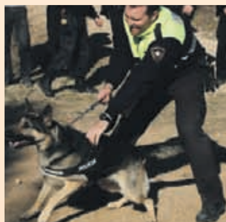
La Unidad Canina hace la mayoría de las intervenciones de drogas