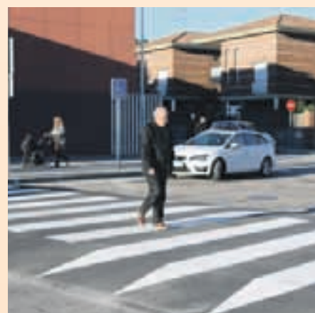
La mayor parte de atropellos se da en pasos de peatones

(802) son los más numerosos. De estos los que más se repiten son los hurtos (25%) y las estafas (24%), fundamentalmente por Internet.