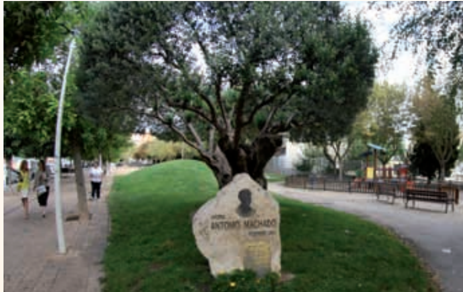
Els comptes preveuen la millora dels parcs infantils