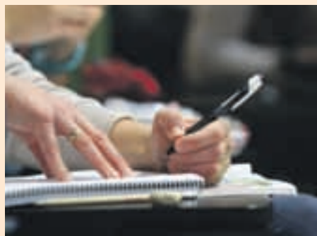
Les aules d'estudi estan obertes a tots els ciutadans

D'aquesta manera, les aules d'estudi estaran obertes des del 2 de gener fins a l'1 de febrer a la biblioteca Aigüesto-