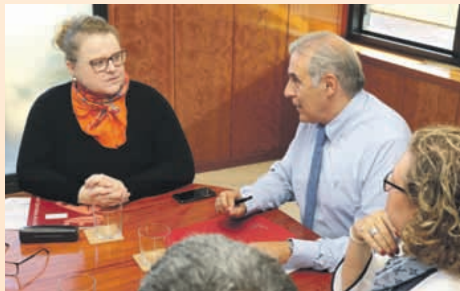
Kosinska mantuvo una reunión con el equipo de Gobierno y los técnicos encargados del proyecto