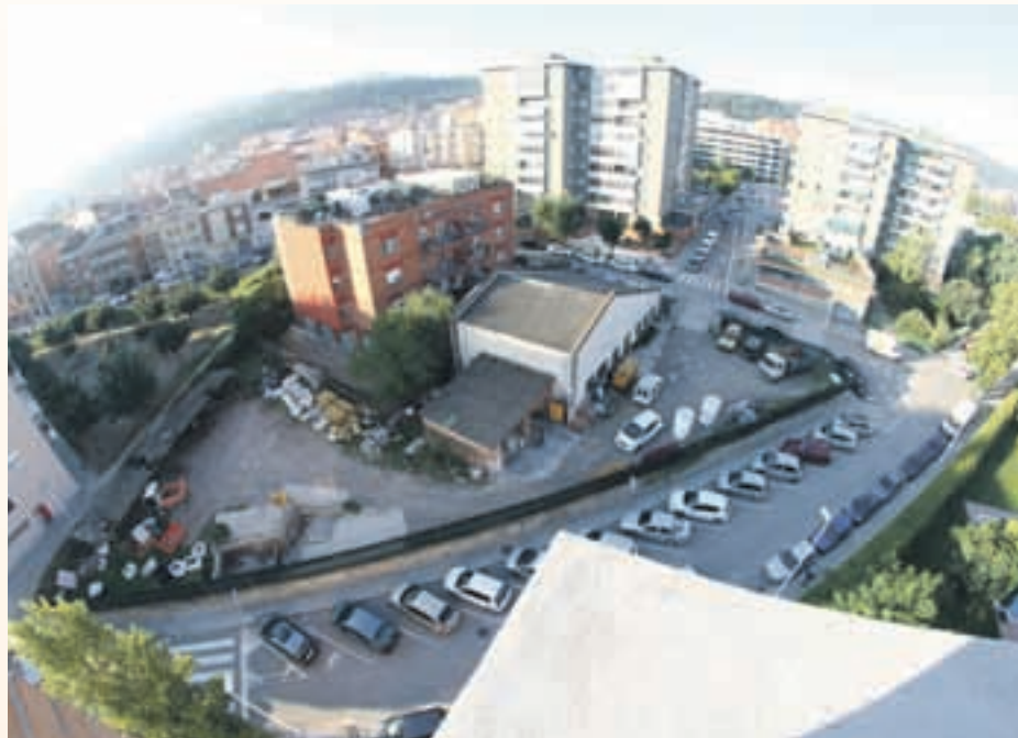
La nova promoció de pisos assequibles es construirà al solar que ocupa la brigada

L'acord preveu que l'Ajuntament ven a l'entitat metropolitana la finca, de més de 1.300 metres quadrats i està ubicada a la cruïlla del carrer de Josep Pla i de Sant Llop per un import de 572.250 euros amb