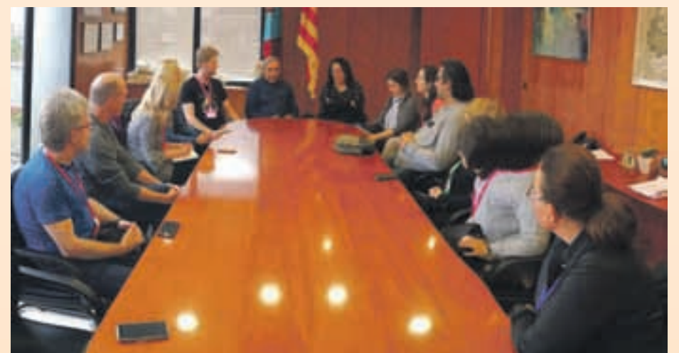
Els professors de diversos països europeus es van interessar pel model de Sant Andreu de la Barca

El programa que impulsa la Unió Europea té com a tema central enguany els monuments UNESCO i durant els dos cursos escolars que durarà la iniciativa els participants treballaran conjuntament aquest tema.