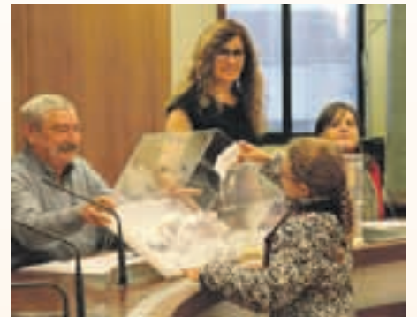
peu de foto

la condició que l'Impsol construeixi habitatges de lloguer assequible.