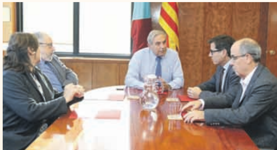
Los responsables de la Generalitat y del hospital durante la reunión con los alcaldes