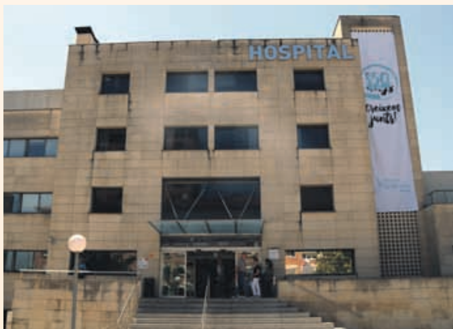
El Hospital de Martorell es el centro de referencia de nuestra ciudad

Evitando desplazamientos se conseguirá una mejor atención y más comodidad para los pacientes mayores o complejos