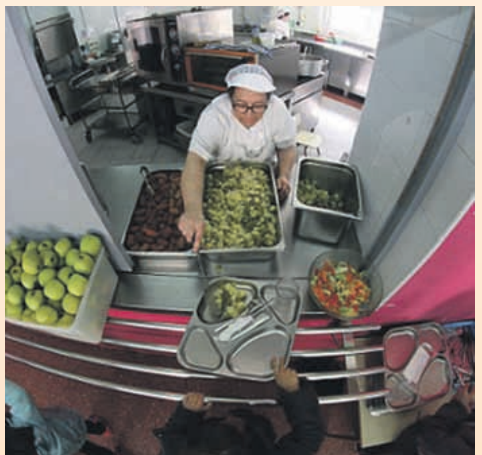
L'any passat 165 nens es van beneficiar d'una beca de menjador

Per poder beneficiar-se d'aquests ajuts, els alumnes han d'estar empadronats a Sant Andreu de la Barca i matriculats en ensenyaments obligatoris i de segon cicle d'educació infantil, a centres educatius del municipi sufragats amb fons públics. Els sol·licitants han d'acreditar, entre d'altres coses, una renda per càpita anual que no sigui superior als límits de renda que s'estableix a la convocatòria d'ajuts pel servei de menjador del Consell Comarcal del Baix Llobregat pel present curs i estar al corrent de les obligacions tributàries.