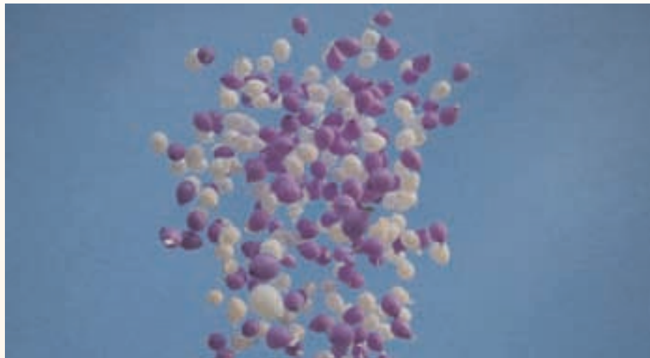
La ciutat ha tornat a mostrar el seu rebuig a la violència de gènere

Amb aquesta declaració institucional, el ple també reclama prevenció, perquè la violència no sigui una opció vàlida en les relacions de parella; recursos per garantir una atenció digna i de qualitat a les dones en situació de violència masclista per a la seva total recuperació, i, especialment, en tot el procés de denúncies i procediment judicials; professionals especialitzats en l'atenció als fills perquè el futur sigui en un país lliure de violència masclista; i recursos d'urgència i atenció de qualitat per donar suport a les dones en situacions de risc i als seus fills.