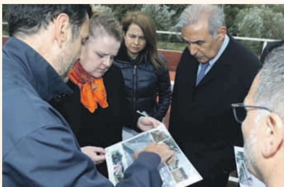
La responsable de la OMS ha conocido los detalles del proyecto en su visita a la ciudad

El Área Metropolitana de Barcelona (AMB) y el Ayuntamiento de Sant Andreu de la Barca impulsan este proyecto, que cuenta con un presupuesto de 900.000 euros y que empezará a ejecutarse durante las próximas semanas. La iniciativa prevé recuperar el cauce del río para el uso ciudadano y contempla la ampliación del parque de la Solana, la mejora del paso que hay por debajo de la autovía A2 y adecuar el camino paralelo al río.