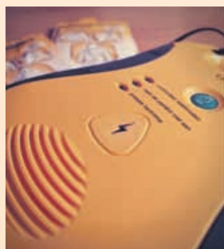
El curso se hará durante el mes de diciembre

El Ayuntamiento de Sant Andreu de la Barca ha organizado dos cursos de primeros auxilios dirigidos a los ciudadanos que quieran tener unos conocimientos básicos sobre cómo actuar en caso de emergencia. La iniciativa, que cuenta con la colaboración de la Diputación, es gratuita y abierta a la población mayor de 18 años. Los cursos se harán en el edificio de las Escoles Velles los días 4 y 11 de diciembre. Las personas que quieran tomar parte de la iniciativa pueden inscribirse hasta el 30 de noviembre llamando al