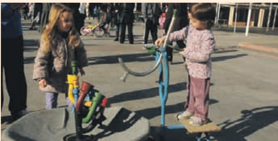
La iniciativa pretén ajudar als pares en la criança dels fills

L'Ajuntament de Sant Andreu de la Barca ha creat una escola de pares que pretén donar les eines necessàries als progenitors perquè puguin comprendre millor als seus fills i poder gestionar els conflictes quotidians, cuidar el nostre benestar i el de les seves famílies.